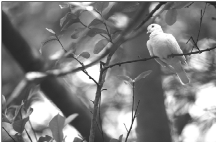
Даже будучи в узак, можно принять свободу во Христе!

У меня появился интерес к жизни, к познанию и учению, ибо это приближало меня к Отцу, раскрывало Его истину и пробуждало к Нему любовь. Я понял, что нужен Ему, и теперь